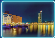
門司港レトロ地区