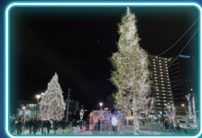
折尾イルミネーション

小倉イルミネーション2024 http://kokura-illumination.jp