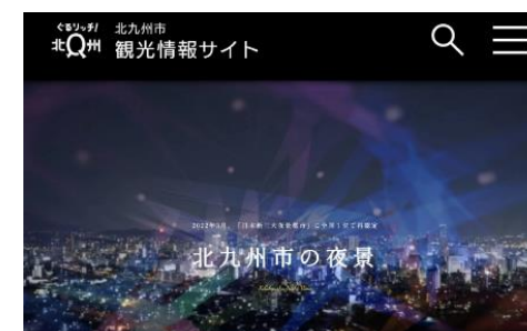
北九州市観光情報サイト「ぐるリッチ！北Q州」