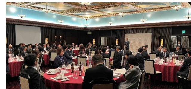
北九州市MICE倶楽部首都圏交流会