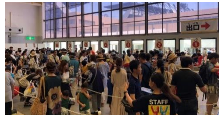
プラレール博 in KITAKYUSHU（前回開催時（平成30年））