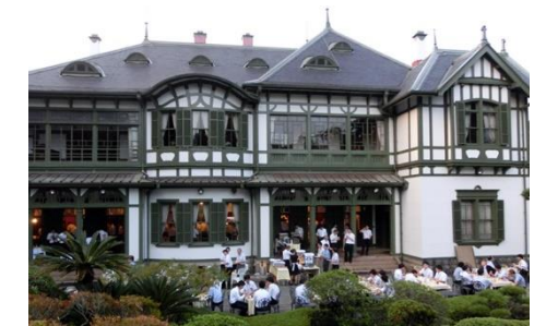
ユニークベニュー（旧松本邸）