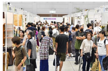
第45回西日本陶磁器フェスタ（前回）