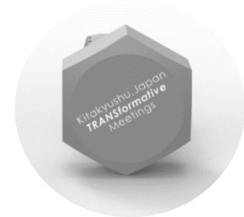
オリジナルネーム入れイメージ