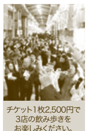
チケット1枚2,500円で3店の飲み歩きをお楽しみください。

●お問い合わせ／門司港はしご酒実行委員会 (トリック3Dアートミュージアム内) ☎093-342-7013