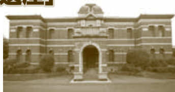
▲官営八幡製鐵所旧本事務所

※年末年始の休園日は平成30年12月29日(土)~平成31年1月1日(火・祝)です。