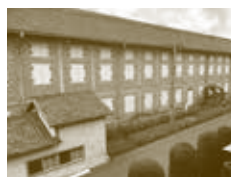
▲富岡製糸場東置倉倉庫

「明治150年」と「明治日本の産業革命遺産」の世界文化遺産登録3周年を記念し、「明治日本の産業革命遺産」福岡県世界遺産連絡会議が主催して、北九州市と中間市・大牟田市を巡回する「鉄都・八幡の誕生」(第1部)、「明治日本の産業革命」の中で、北九州が著しい発展を遂げたことを明示する「石炭と鉄がつくった工業都市・北九州」(第2部)、八幡製鐵所と同じく官営工場で、世界文化遺産の「富岡製糸場—もう一つの「明治日本産業革命遺産」/官営工場」(第3部)で構成し、八幡製鐵所の世界遺産としての意義と北九州の近代史を浮き彫りにする。